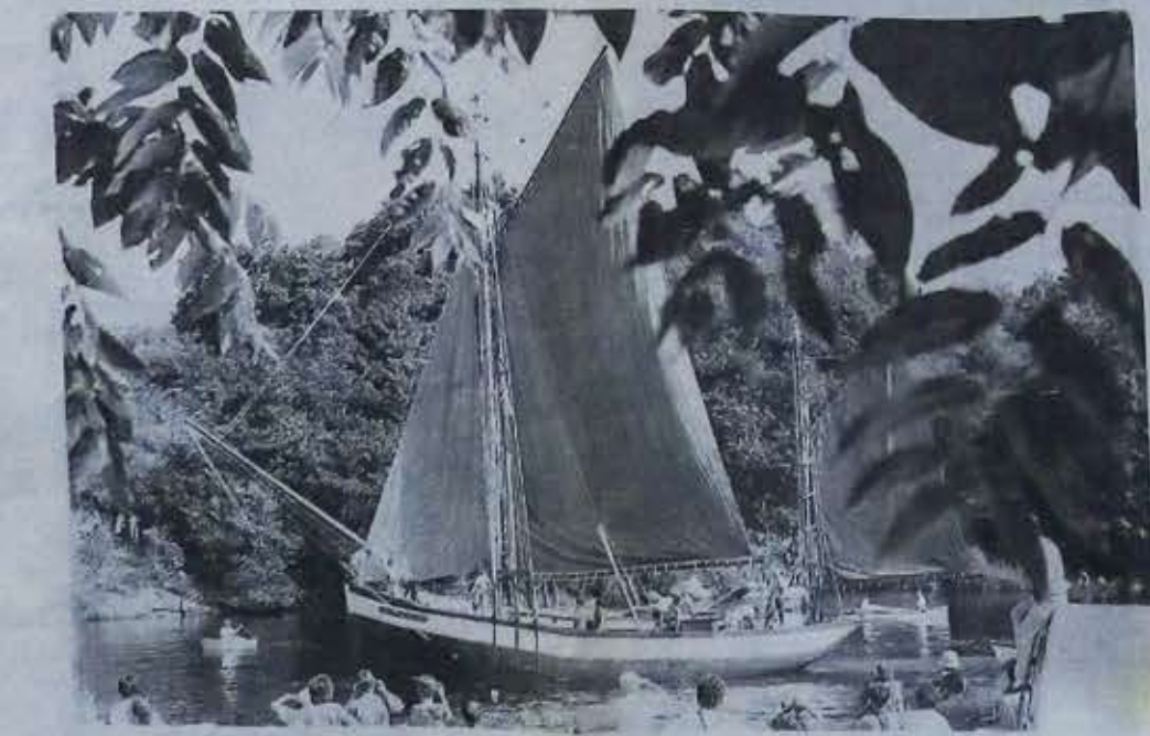
« André Yvette », de Camaret, sur l'Aven. Sompieux. Son arrivée près de « La Belle-Angèle » a fait sensation.