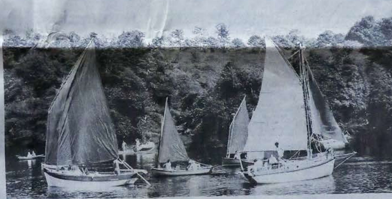
Superbe spectacle sur l'Aven avec les vieux gréements, venus en nombre.